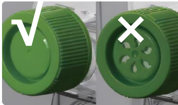
图示：密封瓶盖（左）和透气瓶盖（右）